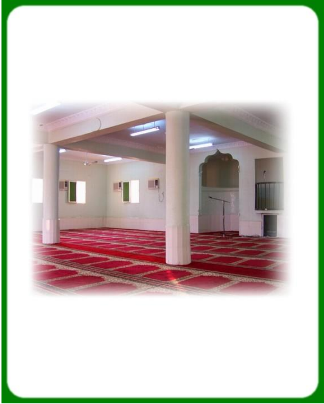
المسجد من الداخل