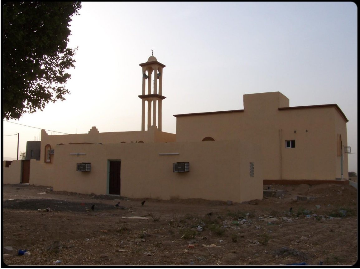
مجمع صلاح الدين الايوبي