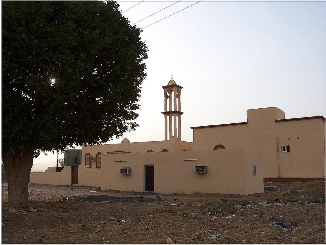
مشهد جانبي لمبنى المدرسه القرآنيه